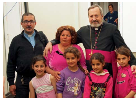
À Erbil, Mgr Gollnisch avec une famille déplacée devant son bungalow.